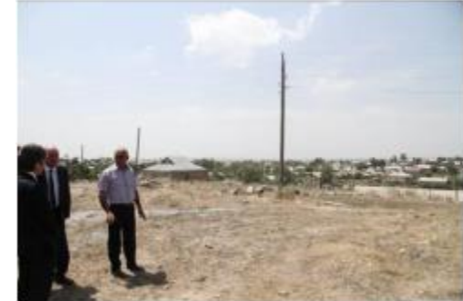
Այցելությունը գյուղապետերի հետ