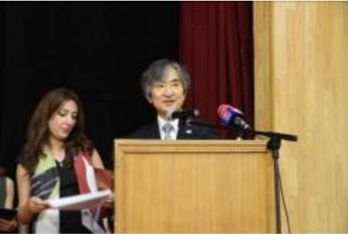
Դեսպան Յամադայի շնորհավորանքի խոսքը