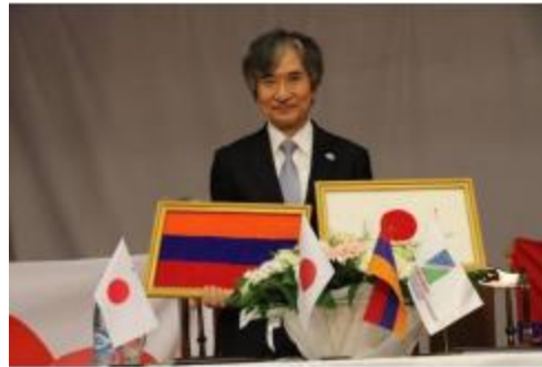
Ազատան գյուղից նվեր