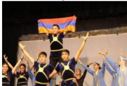
Ավանդական պար երեխաների կողմից