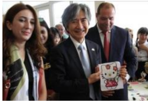
Ձեռքի աշխատանք նվեր