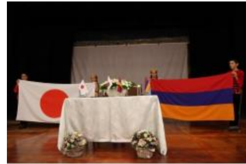
Հայաստանի և Ճապոնիայի դրոշները