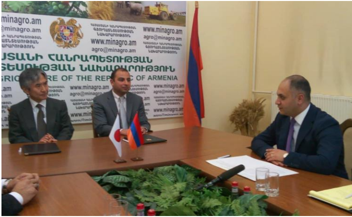
Գյուղատնտեսության նախարարի առաջին տեղակալ պարոն Գևորգյանի ողջույնի խոսքը