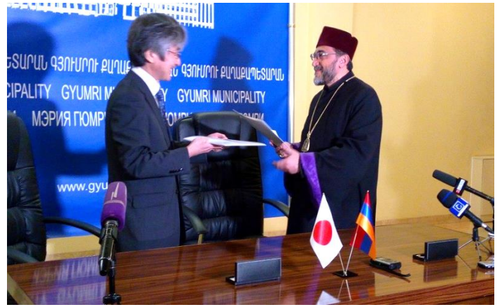
Դեսպան Յամադան և Հայ առաքելական եկեղեցու Շիրակի թեմի առաջնորդ արքեպիսկոպոս Միքայել Աջապահյանը փոխանակեցին պայմանագրերը