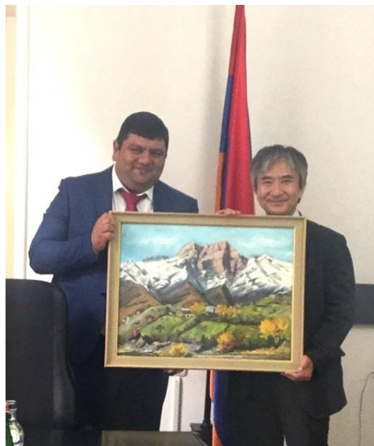
パルシヤン・カパン市長表敬