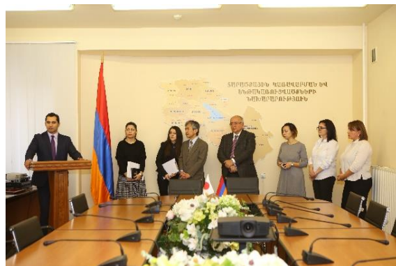
「マイ・ステップ財団」のガザリャン代表による謝辞