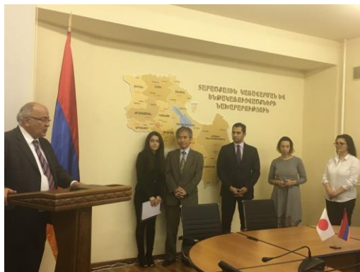
テルテリャン地域行政・開発省第一次官による歓迎の挨拶