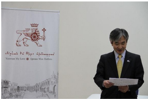
Դեսպան Յամադայի շնորհավորական ուղերձը