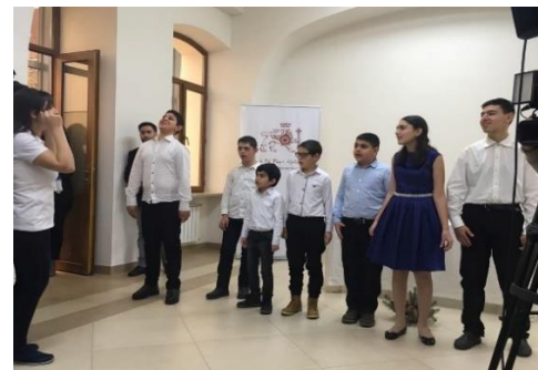
«Լուսէ» կենտրոնի մանկական երգչախումբը կատարում է Կոմիտասի երգերը