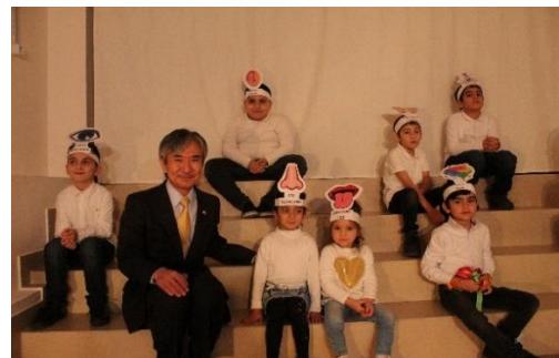
Դեսպան Յամադան «Լուսէ» կենտրոնի երեխաների հետ