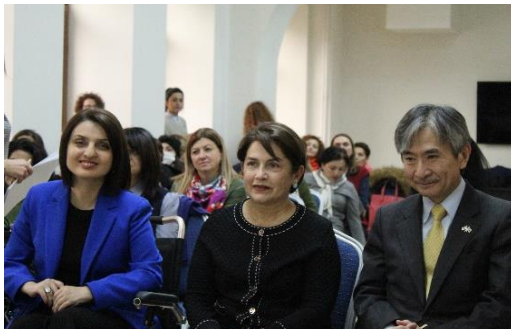
Արարողության պատվավոր հյուրերը: ՀՀ Աշխատանքի և Սոցիալական Հարցերի Նախարար Չարուհի Բաթոյանը, ՀՀ Նախագահի տիկին Նունե Սարգսյանը և դեսպան Յամադան