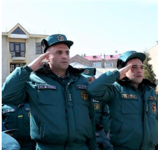
Փրկարարական ծառայության աշխատակիցների ողջույնը