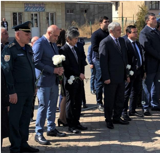
Գնդապետ Գարրիելյանը (հուշարձանի նախաձեռնող), Լոռու մարզպետ պարոն Ղուկասյանը, դեսպան Յամադան, ԱԻ նախարար պարոն Յոլակյանը, ԱԺ պատգամավոր պարոն Պետրոսյանը