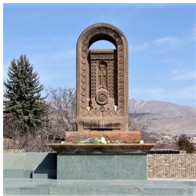
Մայիտակի 1988թ.-ի երկրաշարժին նվիրված հուշարձան