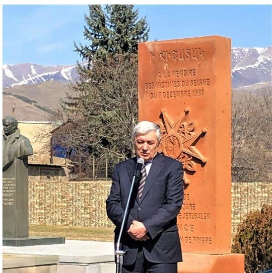
ՀՀ արտակարգ իրավիճակների նախարար պարոն Յոլակյանը