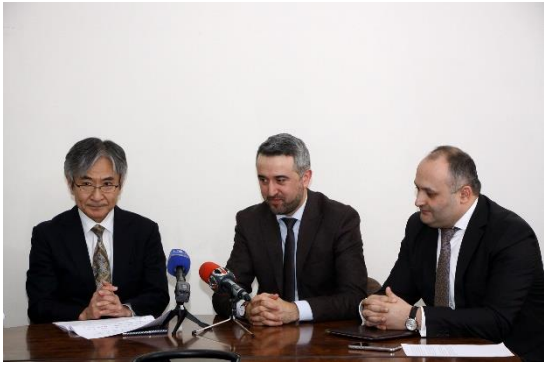
Դենսյան Յամադայի ելույթը