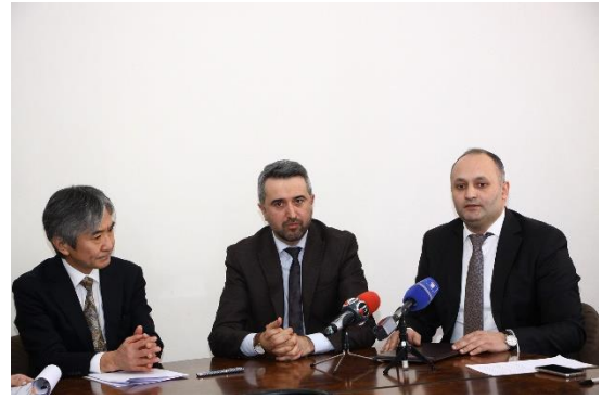
Պարոն Նազարյանի ելույթը