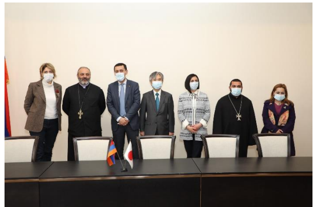
Արարողության հարգարժան մասնակիցները