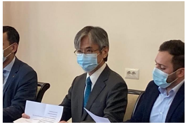
Դեսպան Յամադայի ելույթը