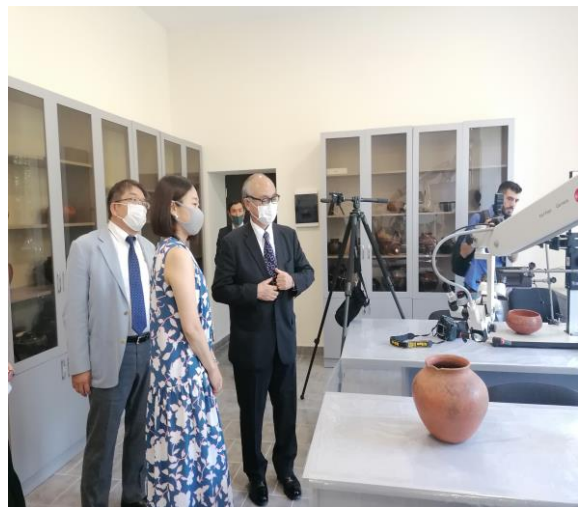
Դեսպան Ֆուկուշիման և Էջիրի Յուկիհիկոն