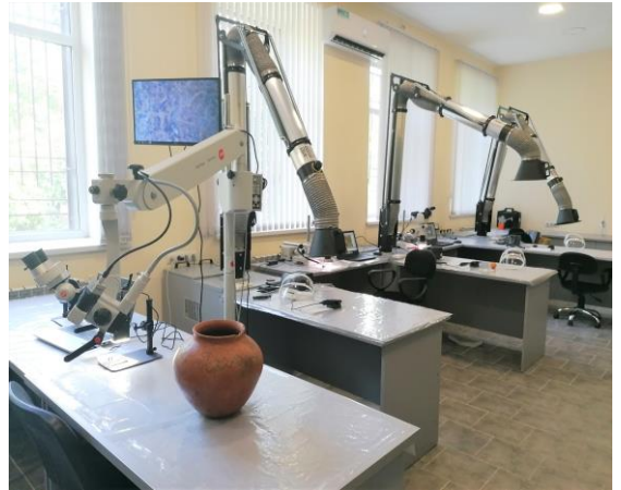
Նոր սարքավորված լաբորատորիան