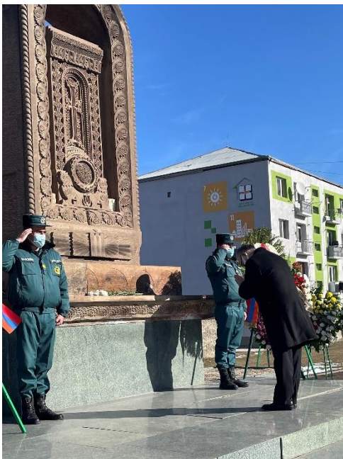
Դեսպան Ֆուկուշիման աղոթում է երկրաշարժի զոհերին նվիրված խաչքարի առջև