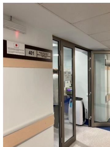
Սենյակը, որտեղ տեղադրված է սարքավորումը