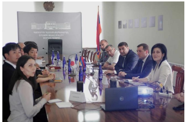
Քաղաքապետերի հանդիպման մասնակիցները