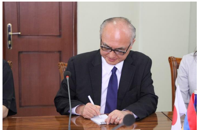
Դեսպան Ֆուկուշիման երկու քաղաքապետների հանդիպման ժամանակ