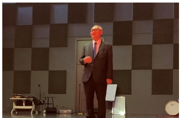
Դեսպան Ֆուկուշիման շփվում է ԹՈՒՄՈ Գյումրու երեխաների հետ