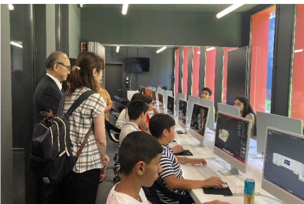
Դեսպան Ֆուկուշիմայի այցը ԹՈՒՄՈ Գյումրի