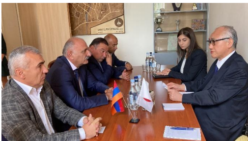
Դեսպան Ֆուկուշիմայի ելույթը

Այս ծրագիրը նպատակ ունի ապահովել ոռոգման ջրի հասանելիությունը բոլոր մշակովի տարածքներում, որտեղ ագարակատերերը կկարողանան զբաղվել արդյունավետ գյուղատնտեսական գործունեությամբ՝ Մալիշկա և Գետափ գյուղերում գործող 898մ ոռոգման ցանցերի վերանորոգման միջոցով: Այս ծրագիրը նաև նվազագույնի կհասցնի ջրի արտահոսքը ոռոգման ցանցերից, որոնք հանգեցնում են տների հեղեղումների և առողջապահական խնդիրների՝ դրանով իսկ նպաստելով ջրային ռեսուրսների արդյունավետ օգտագործմանը: Արդյունքում, տարեկան շուրջ 7000 գյուղերի բնակիչներ կօգտվեն ծրագրից: