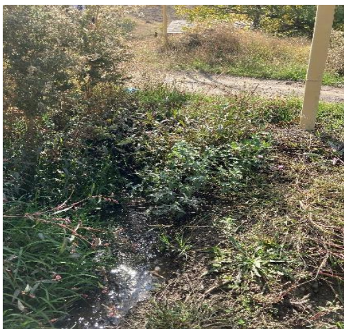
Անպաշտպան ջրատար, որտեղ կտեղադրվի խողովակաշար