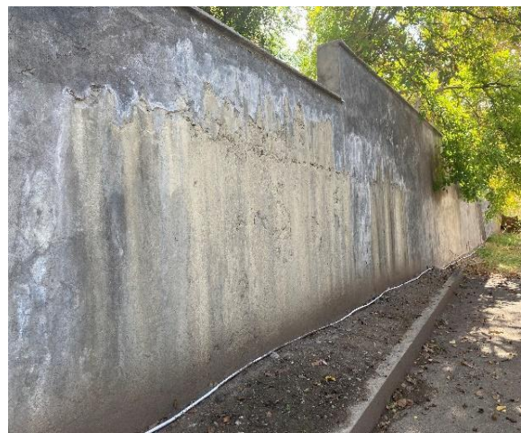
Մալիշկա մանկապարտեզի արտաքին պատը վնասվել է մշտական ջրի արտահոսքից