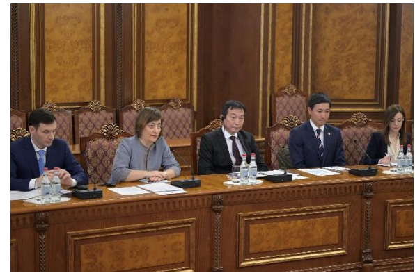
Տիկին Նացվլիշվիլիի ելույթը