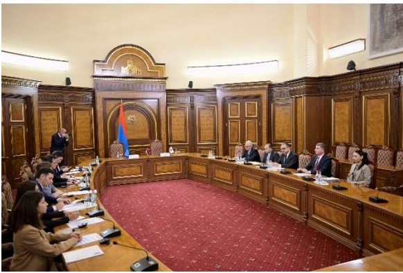
Ստորագրման արարողության դահլիճը

Մասնավորապես, այս նախաձեռնությունը անցյալ տարվա հոկտեմբերին Ճապոնիայի կողմից տրամադրված 2 մլն ԱՄՆ դոլարի չափով «Լեռնային Ղարաբաղից տեղահանվածների համար անհետաձգելի օգնության դրամաշնորհին» հաջորդող ծրագիր է: Ակնկալվում է, որ այն նվազեցնելու է հյուրընկալող համայնքների տնտեսական բեռը, օգնություն է տրամադրելու տեղահանվածներին, ներառյալ բազմաթիվ խոցելի խմբերին, ինչպիսիք են տարեց կանայք և երեխաները, և խթանելու է հյուրընկալող համայնքների և տեղահանվածների միջև սոցիալական ինտեգրացիան՝ դրանով իսկ նպաստելով Հայաստանում հումանիտար իրավիճակի կայունությանը և բարելավմանը: