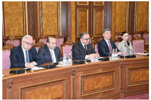
Փոխվարչապետ պարոն Տիգրան Խաչատրյանի ելույթը