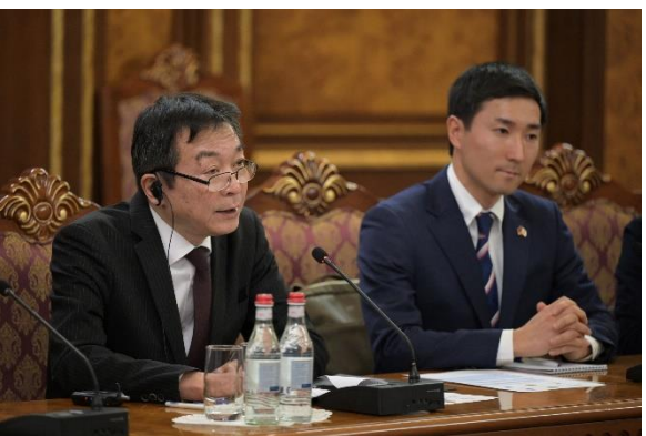
Դեսպան Առկիի ելույթը