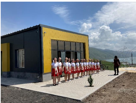
Հայկական ավանդական պարով դիմավորում

Ծրագիրն իրականացվել է տեղական արդյունաբերության դիվերսիֆիկացման և տեղի բնակիչների եկամուտների ավելացման նպատակով: Այս ծրագիրը կունենա տարեկան մոտ 450 շահառու: