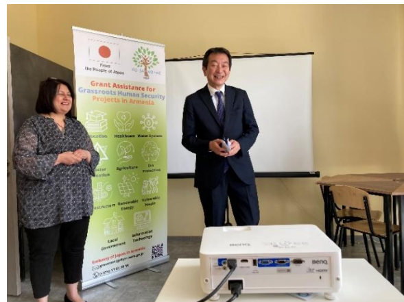
Դեսպան Առնիկի ելույթը