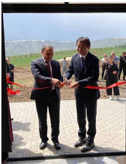
Կարմիր ժապավենի կտրում