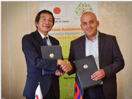
Դեսպան Աոկին և Տաշիր Համայնքի ղեկավարի տեղակալը

Այս ծրագրի նպատակն է բարելավել Լոռու մարզի Տաշիր համայնքի ջրամատակարարման ենթակառուցվածքը՝ վերականգնելով և բարելավելով ջրատարի 15 կմ հատվածը: Ծրագրի արդյունքում Տաշիր համայնքի 11 գյուղերի մոտ 12300 բնակիչներ, այդ թվում՝ Լեռնային Ղարաբաղից տեղահանված մոտ 700 բնակիչներ կունենան խմելու ջրի կայուն և շարունակական հասանելիություն: Սա զգալիորեն կբարելավի տեղի բնակիչների կյանքի որակը և կնվազեցնի տեղահանվածների տնտեսական բեռը: