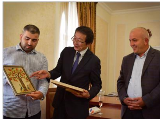
Դեսպան Աոկին ներկայացվեցին ավանդական արվեստների օրինակներ