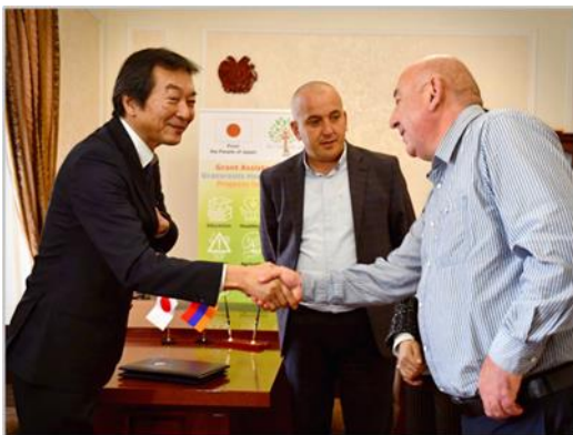
Դեսպան Աոկին շնորհավորանքի խոսքեր ուղղեց ծրագրում ներգրավված կողմերին