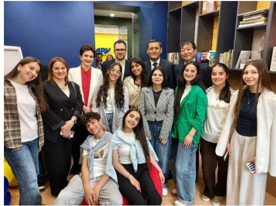
Իսմրային նկար կենտրոնի այցելուների հետ