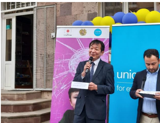
Դեսպան Աոկիի ելույթը

Իր ելույթում դեսպան Աոկին ընդգծեց, որ երկրի էական փոփոխությունը չի կարող իրականացվել առանց նրա ժողովրդի, մասնավորապես՝ երիտասարդների փոփոխության, և նա հավատում է, որ նոր երիտասարդական կենտրոնը, որտեղ երիտասարդները կարող են հավաքվել և համագործակցել, կխրախուսի նրանց ակտիվ մասնակցությունը հասարակական կյանքին: