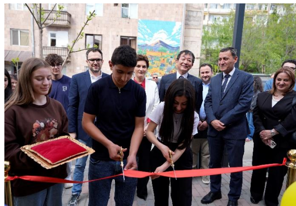
Կարմիր ժապավենի կտրումը