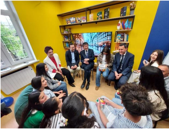
Հանրային տարածքը Վայքում