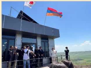
情報技術センター設立