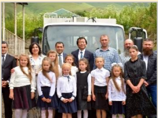
ゴミ収集車両整備