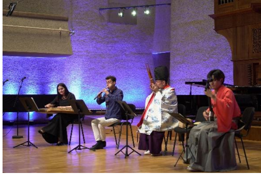
Ճապոնա-հայկական երաժշտական համագործակցություն