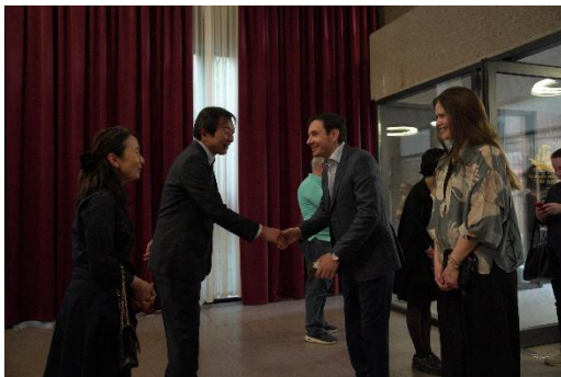
Դեսպան Առկի Յուտական և տիկին Առկին ողջունում են հյուրերին