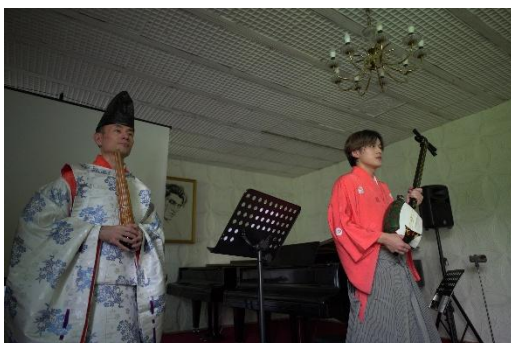
Դասախոսություն-համերգ՝ Ռոմանոս Մելիքյանի անվան պետական երաժշտական քոլեջում