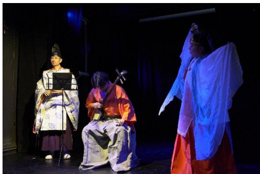
Ճապոնական երաժշտության միջոցառում «Հիկարի» կենտրոնում