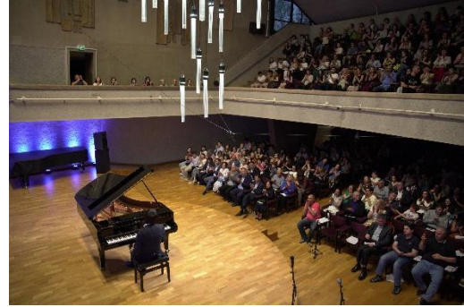
Հանդիսատեսը՝ Կոմիտասի կամերային երաժշտության տանը