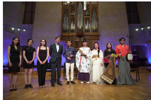
Խմբակային լուսանկար՝ Կոմիտասի կամերային երաժշտության տանը