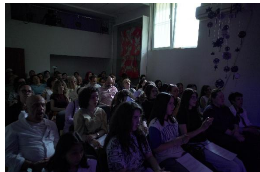
Ճապոնական երաժշտության միջոցառում «Հիկարի» կենտրոնում